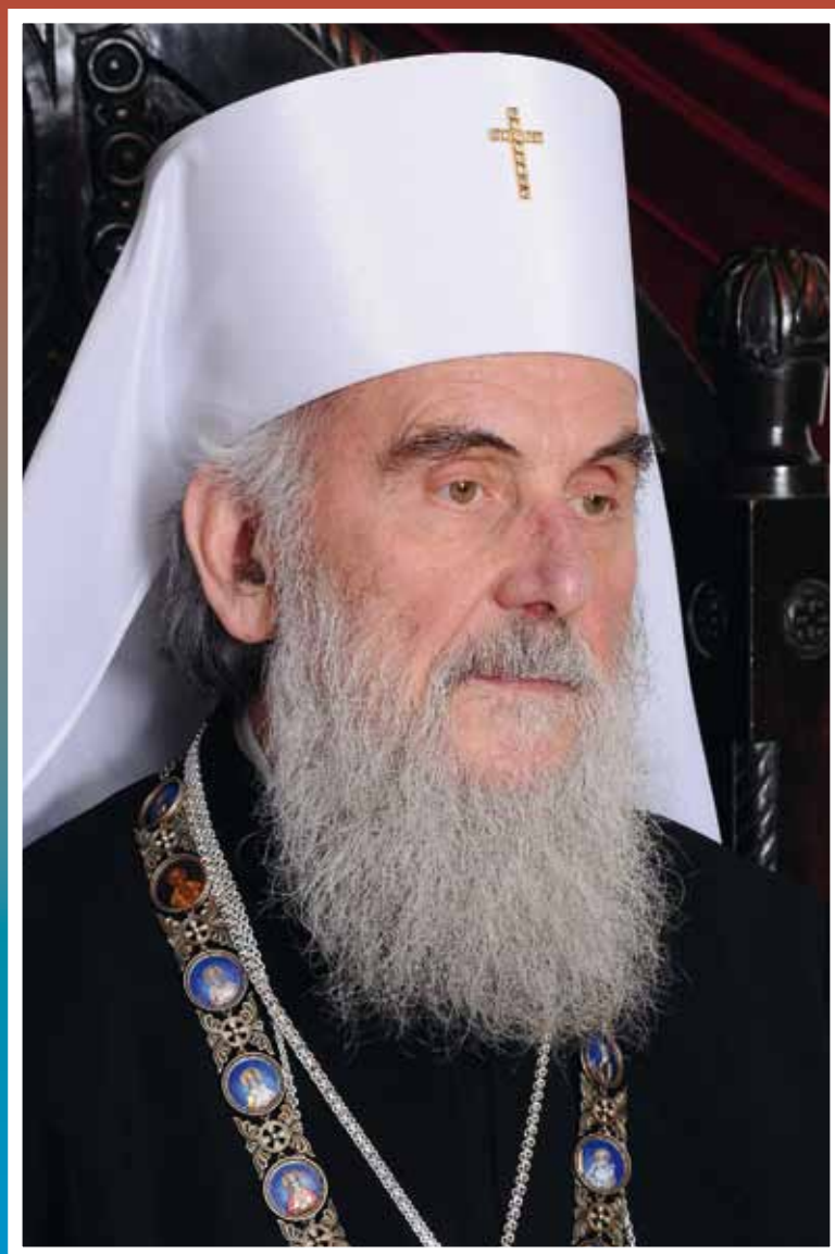
Тихомир Обрадовић Рајко Каришић: фотографије

Сарадња Српске православне цркве и Инжењерске коморе постоји и сада, али моја је велика жеља, а то је и потреба наше Цркве, не само као институције, већ као заједнице, да потребе верника буду много боље схваћене од стране стручњака и од стране оних који су по основу Устава и закона власни да те потребе разумеју, препознају и уваже