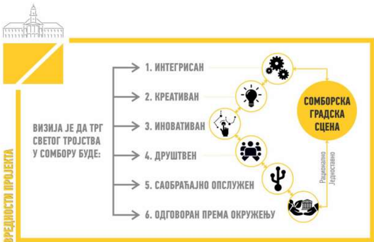
Слика 12: Вредности које се заступају конкурсним решењем „СОМБОРСКА ГРАДСКА СЦЕНА“.

ВРЕДНОСТИ КОЈЕ ЗАСТУПА ПРОЈЕКАТ /// Први корак концептуалне разраде решења за Трг Светог Тројства је избор ВРЕДНОСТИ које се њиме заступају, а које својим обухватом покривају све сегменте његове даље разраде (Слика 12):